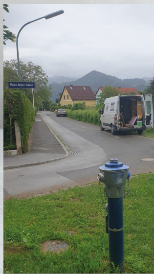
Durch das Parkverbot werden neue Parkplätze benötigt.

Durch das neue Parkverbot in der Franz-Domes-Gasse