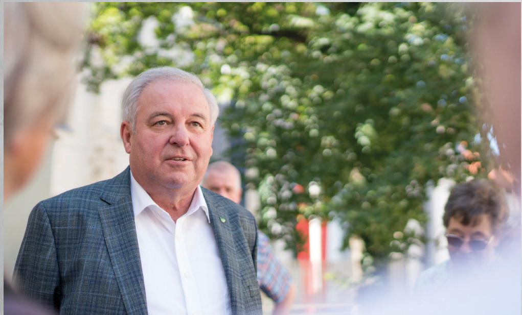
Landeshauptmann Hermann Schützenhöfer appelliert an die Steirerinnen und Steirer, am 28. Juni vom Wahlrecht Gebrauch zu machen.

Landeshauptmann Hermann Schützenhöfer: „Mit dem Wahltermin am 28. Juni folgen wir nicht nur dem einstimmigen Beschluss des Landtages Steiermark, sondern auch dem Wunsch der überwältigenden Mehrheit der steirischen Gemeinden. Die Abhaltung von Wahlen gehört zu den Kernaufgaben einer Demokratie, das Wahlrecht ist ein hohes Gut! Wir werden alles Erdenkliche tun, damit bei der Durchführung der Gemeinderatswahl die Wählerinnen und Wähler sowie die Mitglieder der Wahlbehörden bestmöglich vor einer COVID-19-Ansteckung geschützt sind. Es ist unter Einbindung von Bundes- und