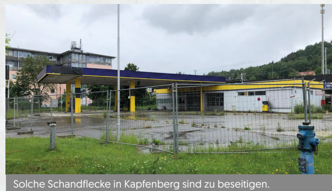
Solche Schandflecke in Kapfenberg sind zu beseitigen.

kunft hat Kapfenberg eine Vorreiterrolle einzunehmen.